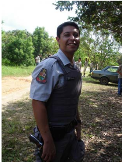
Sd PM Guimarães