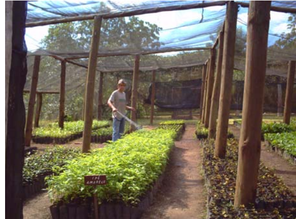
Irrigação das mudas