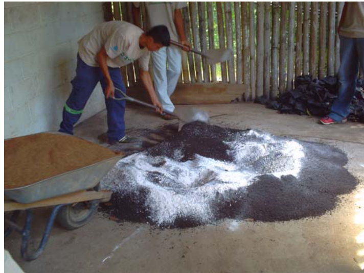
Preparo de substrato