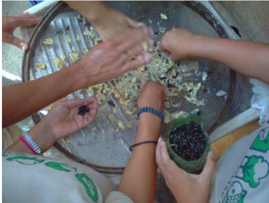
Preparo de sementes