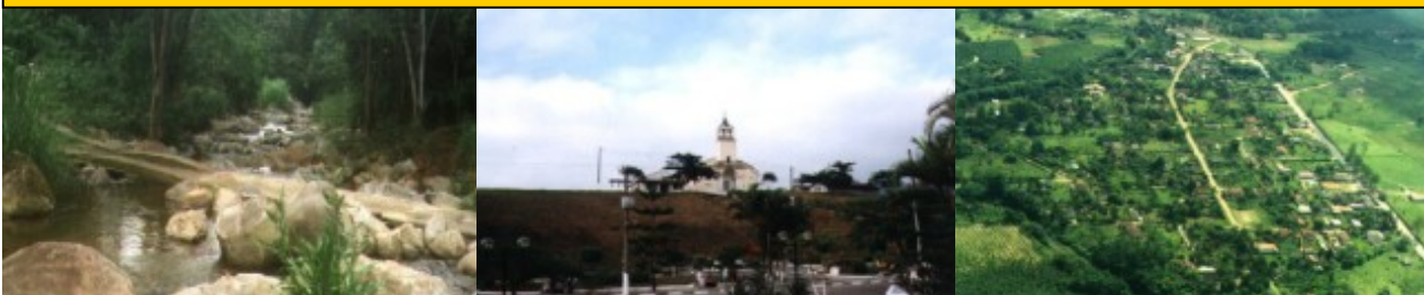
PEDRO DE TOLEDO