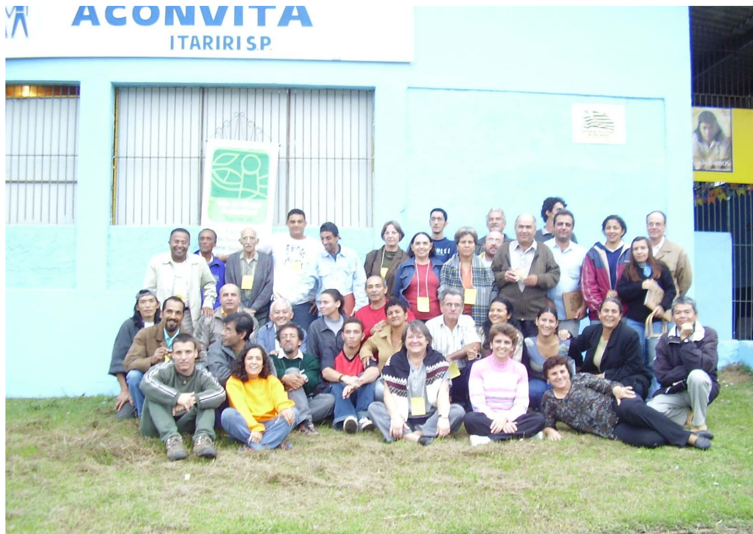
Projeto Vale do Ribeira Sustentável – Agenda 21 Relatório da Oficina de Nivelamento Conceitual e Planejamento – Realizada em Itariri em 05 e 06 de julho de 2005 com participantes de Pedro de Toledo, Itariri, Peruíbe, São Lourenço da Serra, Juquitiba, Miracatu, Tapiraí e Juquiá