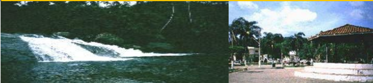
SÃO LOURENÇO DA SERRA